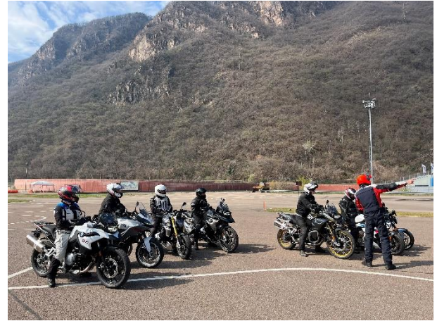
Bild 2: Auch 2024 werden wieder zahlreiche Trainings und Touren stattfinden