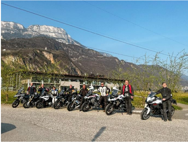
Bild 1: Glücklich und zufrieden. Die Teilnehmer des letztjährigen Saisonstarts „First Ride of the Season“.