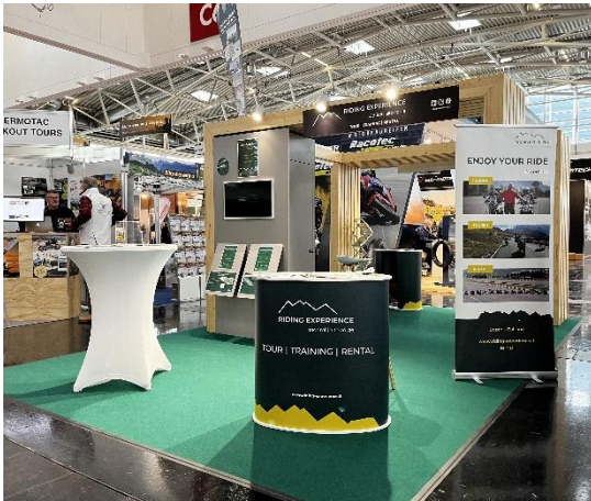
Bild 3: Vom 16.-18. Februar wird Riding Experience Südtirol auf der IMOT vertreten sein.