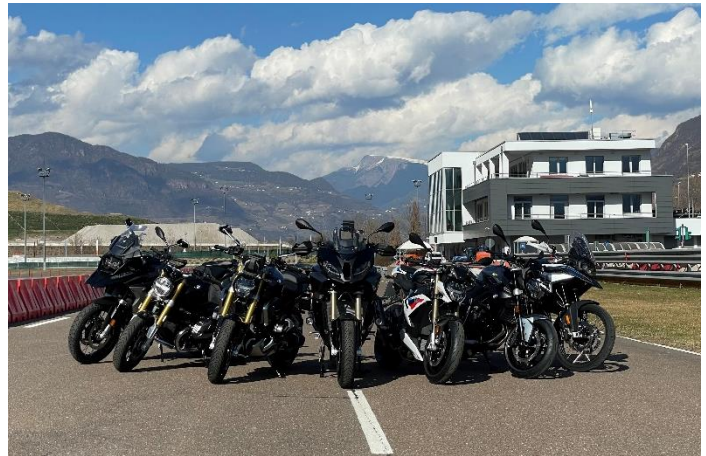
Bild 4: Die neusten Modelle von BMW-Motorrad warten auf alle Motorradfans in der neuen Motorradflotte von Riding Experience Südtirol.