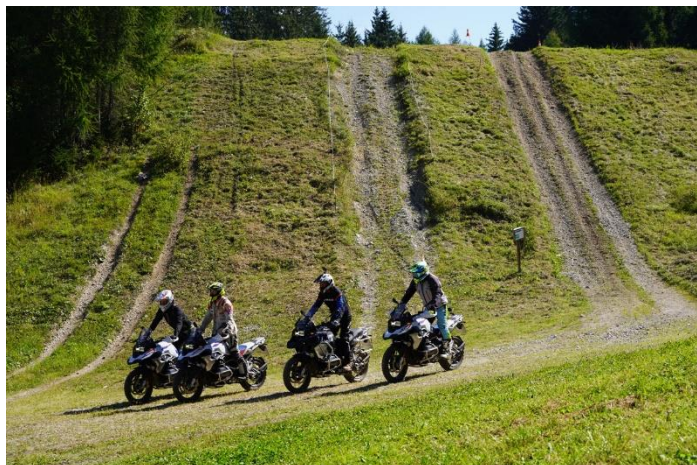
Figura 1: Allenamento di gruppo – controllo della moto in discesa