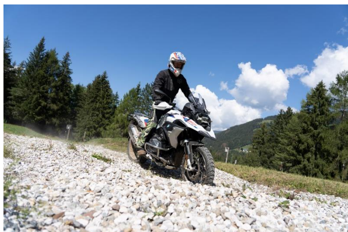
Figura 3: Controllo della moto su sentieri di ghiaia