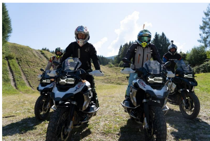
Figura 4: Allenamento di gruppo – divertimento alla guida