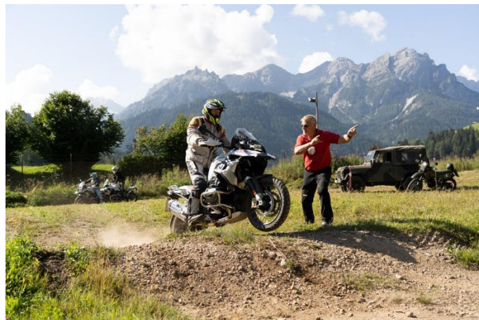
Figura 2: Corso di guida offroad al parco militare in Val Pusteria