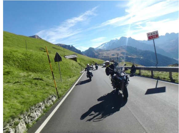
Immagine 2: Riding Experience Alto Adige – la combinazione ideale di corsi e tour in moto