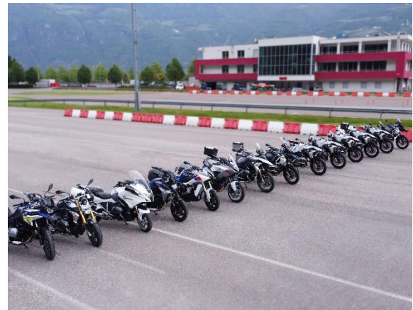
Immagine 4: Parco moto a noleggio nuovo ad ogni stagione