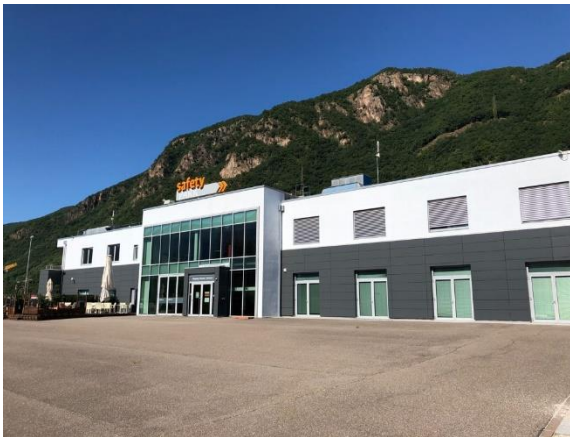
Immagine 3: Safety Park – edificio business per i vostri eventi con sale meeting e ristorante