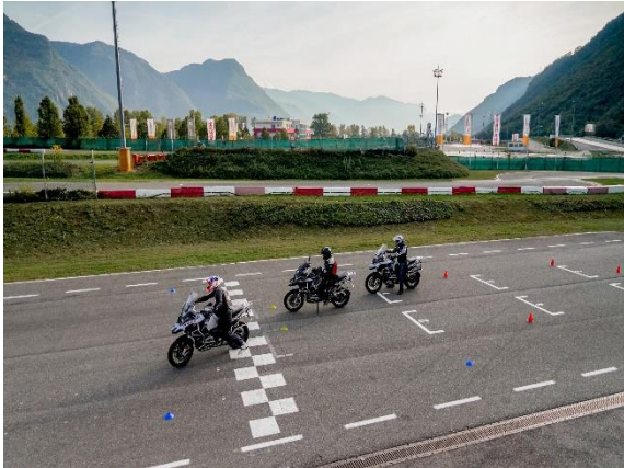
Immagine 1: possibilità di allenamento al Safety Park