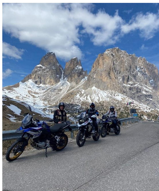
Figura 4: Tour 1 giorno Offroad