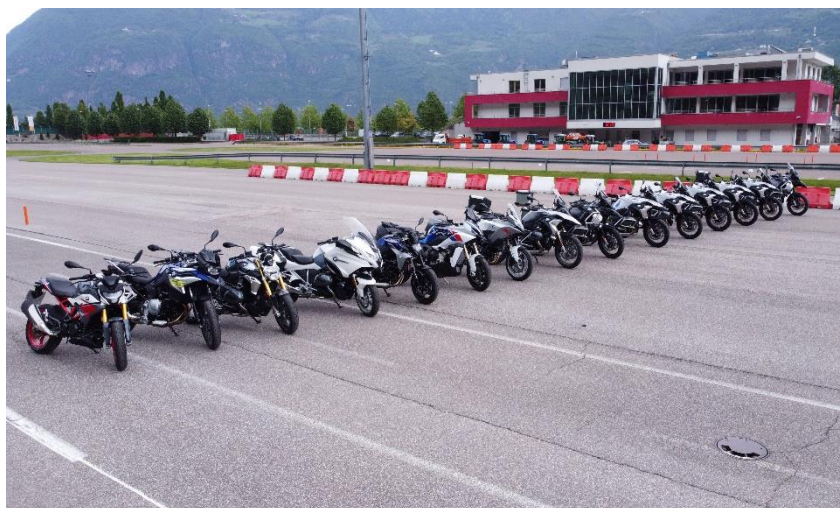
Figura 2: Flotta moto BMW 2022 a noleggio