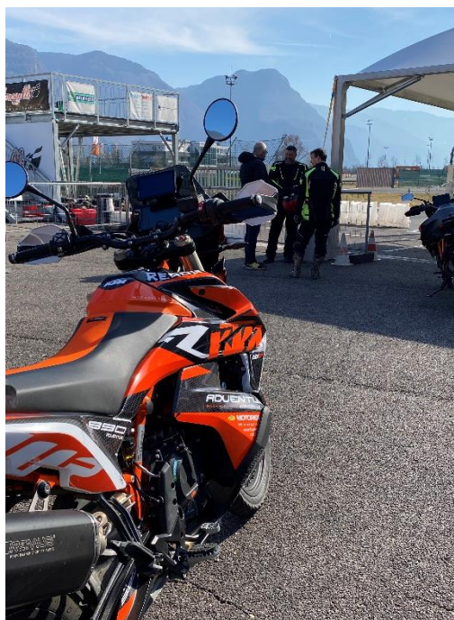
Figura 1: KTM Riders Academy