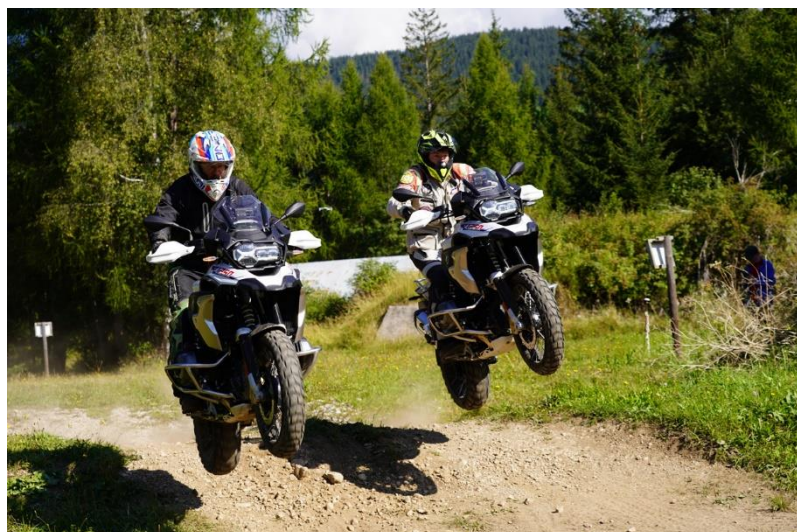
Figura 3: Training Offroad in Val Pusteria