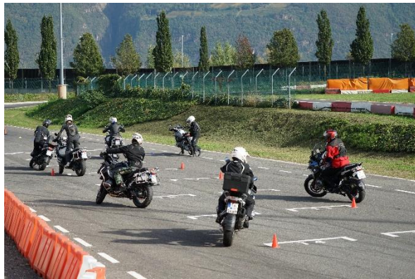
Bild 3: Motorradtraining im Safety Park Südtirol: Spielerische Vorbereitung auf die umliegenden Bergherausforderungen