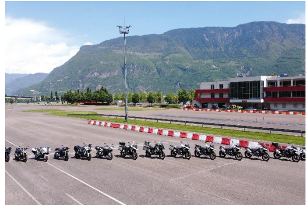
Bild 2: Brandneuer Mietfuhrpark: 15 BMW Motorräder in technischer Vollausrüstung