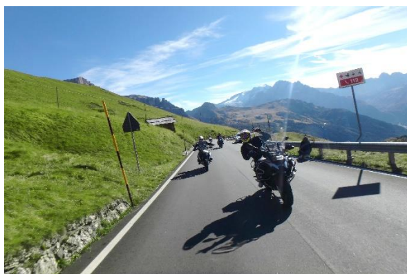
Bild 5: Der Berg ruft: Aus dem Safety Park Südtirol direkt in die Bergwelt Südtirols eintauchen