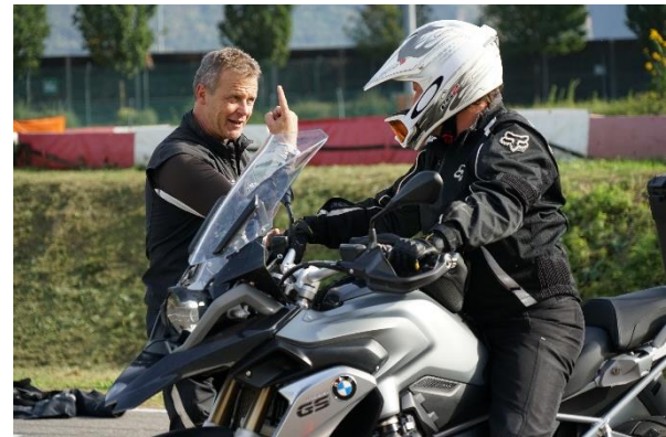
Bild 4: Motorradtraining im Safety Park Südtirol: Individuelle Rückmeldung als wichtige Säule der Technischulung