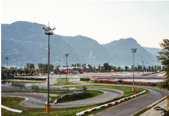
Bild 1: Der Safety Park Südtirol: einzigartige Motorrad-Trainingslocation in Bozen umrahmt von den Südtiroler Bergketten