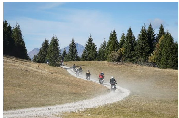
Bild 6: Motorradtouren in Südtirol: Abenteuer pur