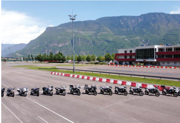
Bild 1: Die brandneue BMW Motorrad Flotte der Riding Experience Südtirol vor dem Safety Park Südtirol und der charakteristischen, umliegenden Bergkulisse