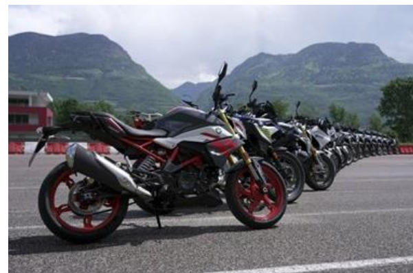
Bild 4: Hier ist für jeden etwas dabei – Facettenreicher Motorradpool der von sportlichen Roadstern über komfortable Tour-Cruiser bis hin zu einer Vielzahl an Adventure Modellen reicht