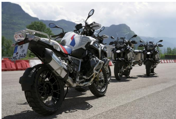
Bild 3: Mehrere BMW 1250 Adventure warten auf Ihren ersten Einsatz in der Bergen Südtirols