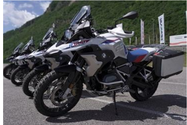
Bild 2: BMW 1250 in verschiedenen Versionen – der Modellschwerpunkt von Riding Experience Südtirol